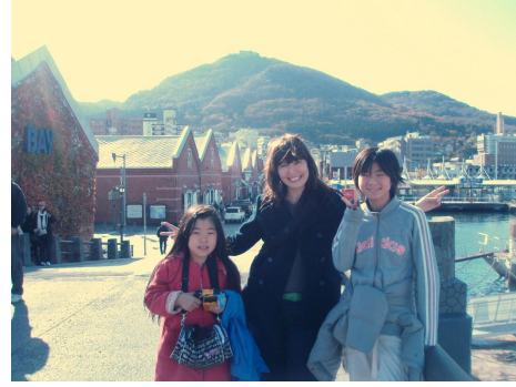
バイエリア…古いレンガの倉庫を利用した 素敵な観光名所です。

教室へ戻りラストパートです。そして、いよいよプレゼンテーションの時間です！ 『トーマス・エジソン』のレポートの発表、作ったジオラマの説明、エジソンについての質 疑応答と大変内容の充実した英語 100%の素晴らしいプレゼンテーションでした。エジソン は子どもの頃は問題児だったんですね。電気の他にも色々な発明をしていたんですね・・・。 子ども達だけでなくスタッフも大変勉強になりました！！ 楽しい思い出をありがとう！ 来年また会いましょう！