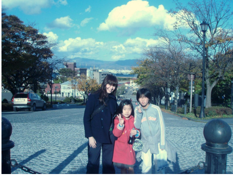
八幡坂…函館を舞台にしたサスペンス ドラマには欠かせない場所！ ポッキーのCMにも登場したよ！